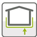
HYDROIZOLACE SPODNÍ STAVBY

HYDROIZOLAČNÍ PÁS Z OXIDOVANÉHO ASFALTU S VLOŽKOU ZE SKELNÉ ROHOŽE A S POVRCHOVOU ÚPRAVOU MINERÁLNÍM JEMNOZRNNÝM POSYPEM